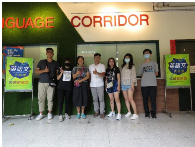
圖說：擔任亞大英語文先修營營隊助教們受訓後合影。

語發中心為新生所辦英語文先修營如期進行，前 6 週是網路線上課程，7 月 20 日起線上同步學習。